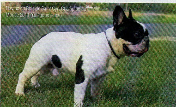
Flavius du Bois de Saint Cyr, Champion du Monde 2011 (catégorie jeune)