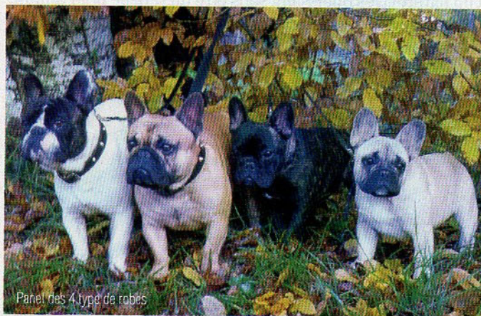
Panel des 4 type de robes